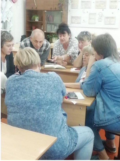
Заместитель директора по УВР